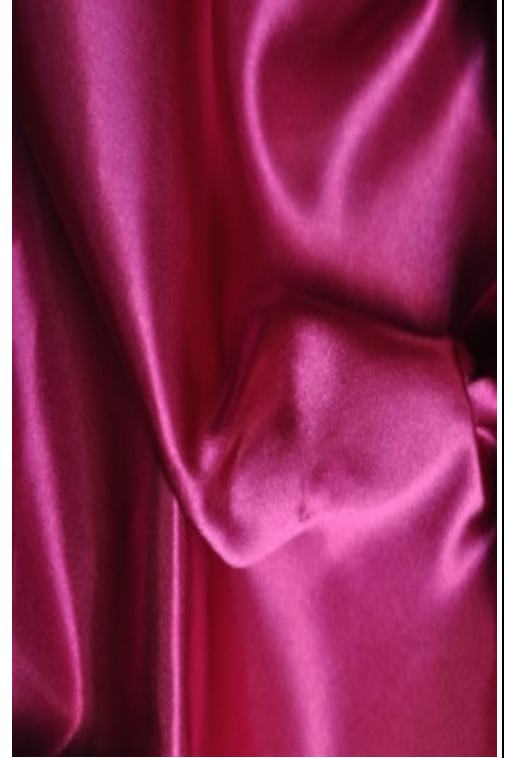
Fuschia Pink / Rose Fuschia