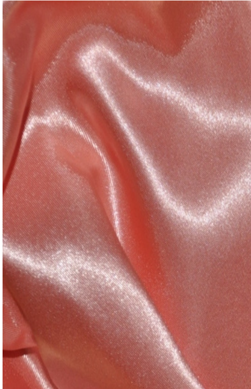
Salmon Pink / Rose saumon