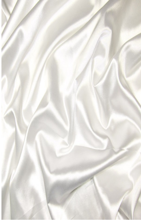
White / Blanc