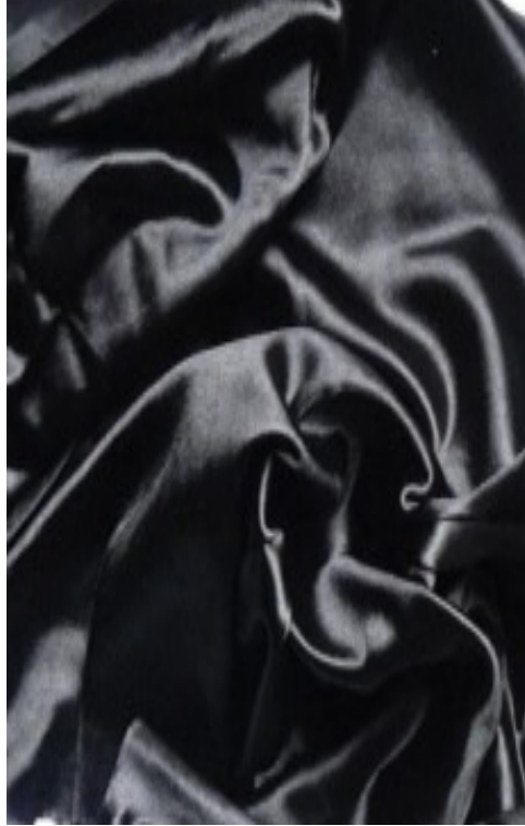
Black / Noir