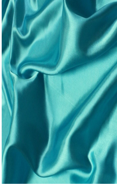
Turquoise / Turquoise